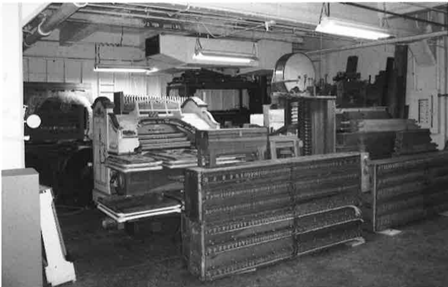
Vue du matériel avant son remontage